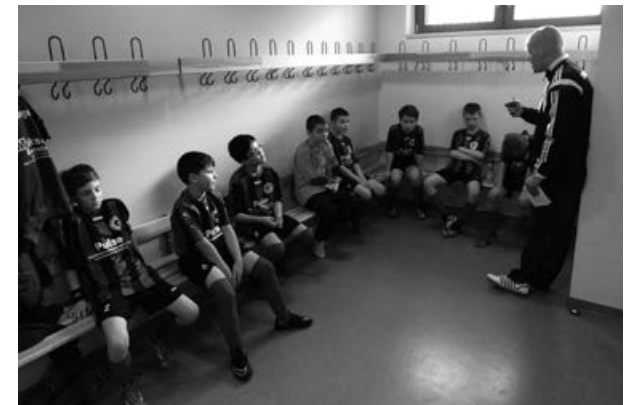
Wissen die Jungs die Anweisungen des Trainers umzusetzen ?!

In der diesjährigen Hallenrunde sind wir mit zwei gleich starken Mannschaften bestehend aus jeweils sieben Spielern angetreten (E3/E4). Personell sicherlich ein Wagnis, wenn man bedenkt, dass wir uns mitten in der Erkältungszeit befanden. Bei einem Kader von 14 Kickern sollte gewährleistet sein, dass jeder eine Menge Spielpraxis mitnehmen konnte, um sich weiterzuentwickeln. So kam es, wie es kommen musste. Die für die Halle gemeldete E3 hatte vom ersten Wettkampf an mit den Folgen krankheitsbedingten Ausfalls zu kämpfen, so dass kein Spieltag mit einem kompletten Team gespielt werden konnte. Folgerichtig hat es für den Einzug in die Zwischenrunde A nicht gereicht. Es gilt trotzdem den Jungs ein großes Kompliment auszusprechen, da sie in Ihren Spielen nie aufgesteckt haben und immer marschiert sind. Gemeldet für die B-Runde haben sie es geschafft, sich dort für die Finalrunde zu qualifizieren.