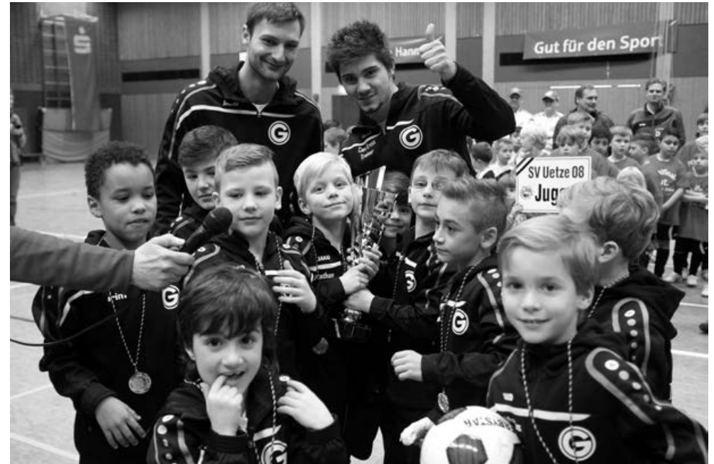
So sehen Sieger aus: Germanias F-2-Junioren jubeln mit dem begehrten Pokal.