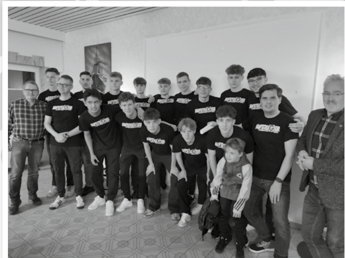
1. B-Jugend Meister und Aufsteiger in die Bezirksliga & Kreispokalsieger